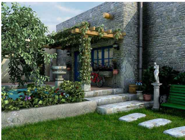
GNU Free Documentation License. Low Resolution